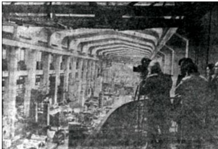
U JUGOTURBINI. Vukotićevu ekipu je u proljeće 1979. na terenu posjetio i fotoreporter Karlovačkog tjednika.

No, tu nije kraj iznenađenjima, ali i ekskluzivnim filmskim zapisima. Jer, iste večeri nakon Karlova , na Edisonovo platno dolazi Petak , film koji su 60-ih godina prošlog stoljeća snimili srednjoškolci, članovi Kino sekcije tadašnje Gimnazije "Dr. Ivan Ribar". Ne propustite izvrsnu priliku da usporedite rad sadašnjih gimnazijske Videodružine i Kinokluba s filmskom produkcijom mladih u nekom prošlom vremenu! (mp)