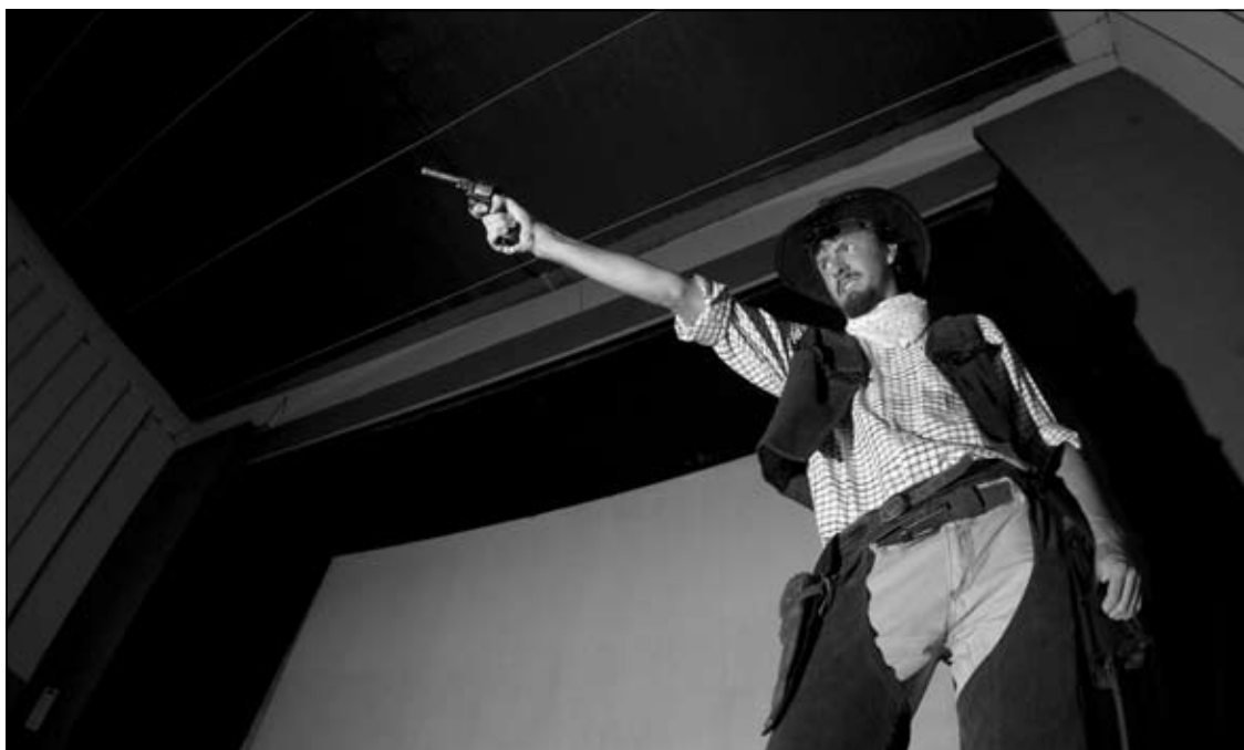
KAUBOJ. Zvijezdu vesterna, još mrzovoljnu i neispavanu, je naša ekipa zaskočila odmah po silasku s velikog ekrana u Edisonu . Odobrovoljili smo ga tek kad smo mu dopustili da s ekrana dovede i konja. A potom je, nevjerojatno raspoložen, festivalskim letcima razveselio brojne sugrađane.