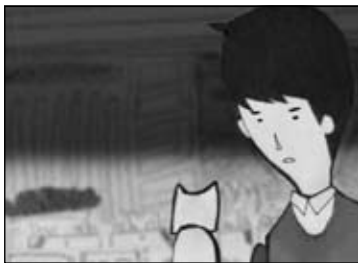
A KISS FROM A KITTY.