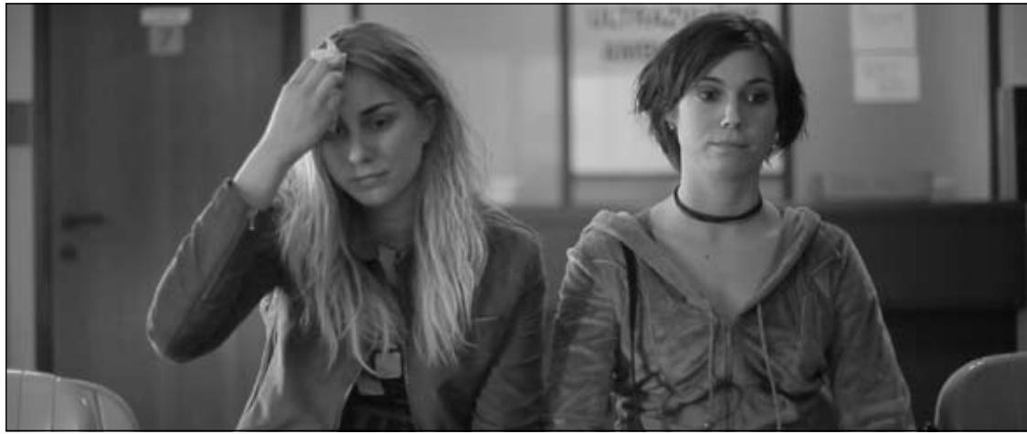
FLEKE. Napeti triler iz zagrebačkog predgrađa sa srednjoškolcima kao glavnim likovima.

Stepenicu-dvije više penjemo se nakon projekcija u Zorin domu. Put prema Starom gradu i ove godine vodi ravno do zvijezda.