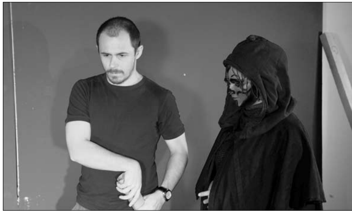
TIŠINA, SNIMA SE! Darth Maul(ica) pažljivo sluša redateljeve upute.

Oni ne govore puno, kao ni njihov kameni izraz lica. Tek mig brkom, pućkanje dima cigarete i mračni pogled ispod plašta. Četiri para očiju promatraju svaki pokret na stolu za poker. Napetost se reže u zraku kao mortadela. Konačno, pobjedonosni izraz lica naočite persone s kaubojskim šeširom na glavi i karte za film padaju na stol. Pogled zaiskri i ispod crnog plašta proviri svijetleći mač, jedina lampa u prostoriji posrne, a mrak osvijetli neopisiv metež, pucnjava i bljeskanje oružja ... "Rez! Ponovno!", sukob četiri filmska svijeta prekida snimatelj, jer je situacija na rubu paljenja školskog alarma. Zvučalo je predobro da ne bi bilo istinito. Četiri filmska lika iz četiri filmska žanra – kauboja, Charlieja Chaplina, Darth Maula i Baltha-