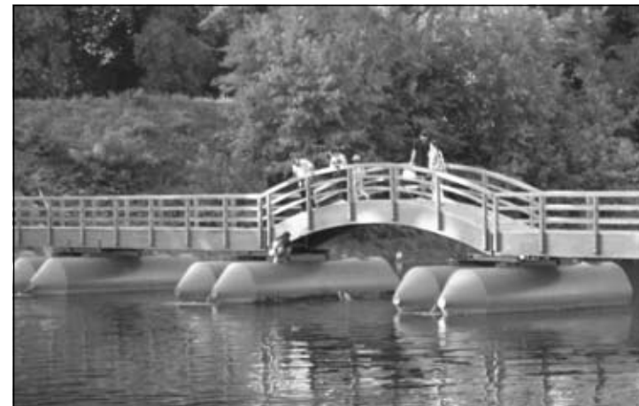
RONI K'O VELIKI. Ni najhrabriji plivači nisu ga uspjeli vratiti na površinu.

U međuvremenu, festivalska ekipa razmišljala je o tome da jedan sektor festivala iz filmskih preseli u koranske vode, jer se sumnjalo da je banner iskorišten za izgradnju brane lokalnih dabrova, ali prema posljednjim neslužbenim vijestima, viđen je kako se kočoperi na starom mjestu – na ogradi mostića. Nije još jasno kako je tamo dospio, ali važno je da je puistolovina u festivalskom undergroundu imala sretan ishod. Rasplet situacije potvrdio je da se od koranske vode ne dobiva osip, već samo dobra priča, i dao filmskom festivalu finu eko-notu, no ostaje za razmišljanje što možemo učiniti da bi povećali kvalitetu života festivalskih rekvizita u vruće ljetne dane, jer ipak – oni govore u naše ime. (sv)