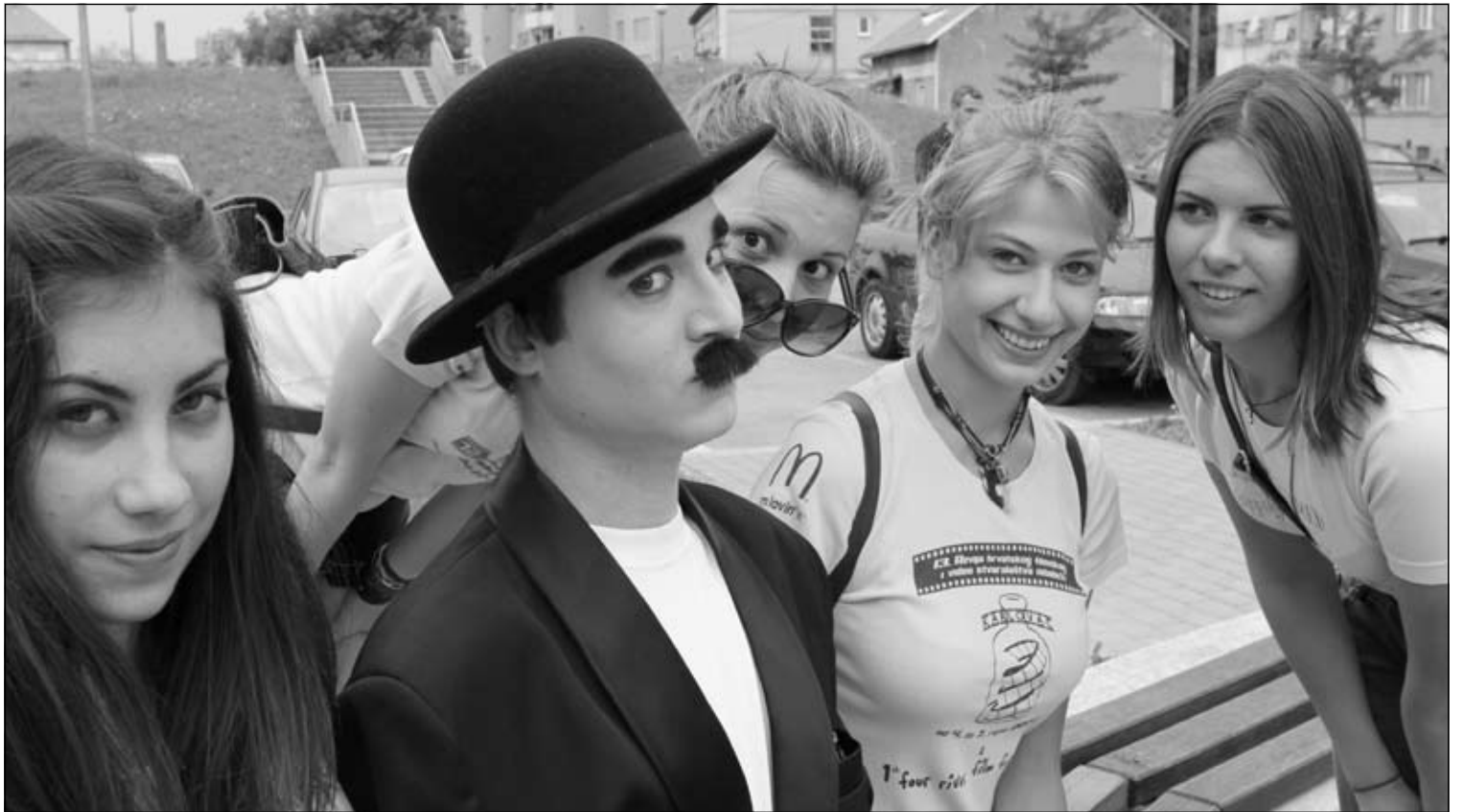
CHARLIE CHAPLIN. Junak nijemog filma se odmah po dolasku u Karlovac pridružio festivalskim volonterkama.

Vjerojatno je već svim stanovnicima grada na četiri rijeke dobro poznato kako će i ove godine njegove ulice preplaviti najčući filmski festival na svijetu uz obilje pozitivne energije i dobre zabave. Za one kojima je to kroz proteklih 365 dana slučajno skliznulo s uma, Kinoklub Karlovac pripremio je zanimljive "podsjetnike" pa se nemojte iznenaditi ako vas ovih dana u gradu slučajno presretne jedna od četiri ovogodišnje maskote festivala. Kad se na karlovačkim ulicama svojim veselim korakom prošetao Charlie Chaplin, jedva se odupirao navali djece, mlade Karlovčanke su mu neprimjetno namigivale, a pripadnici nešto starije generacije njegovom pojavom bili su oduševljeni gotovo kao i najmlađi. Potom se pojavio i kauboj. Opasno naoružan i blago preplanuo od sunca, parkirao je svoga konja pa prohujao karlovačkim ulicama. Dok je od prolaznika izmamljivao brojne osmijehe, simpatični volonteri podijelili su im na tisuće letaka. (km)