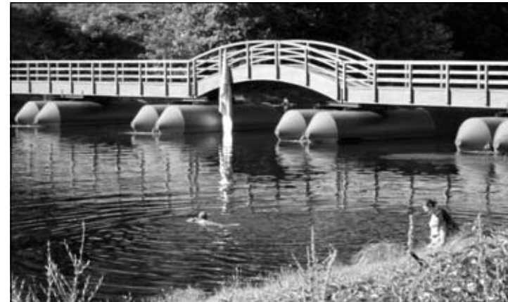
NA PUTU PREMA DOLJE. Festivalski banner se odlučio rashladiti u rijeci.

Šok i nevjericu ispunili su ljetni dan na koranskom kupalištu – festivalski banner nestao je sa svog službenog mjesta prebivališta – pontonskog mostića. Dopolisnici Dnevnika u boci našli su se na mjestu događaja u vrijeme zločina i potvrdili da je banner bez prisile samoinicijativno spuznuo u vodu.