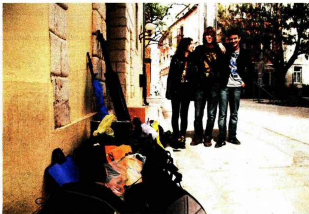
PUNO JE OPREME ZA FILM