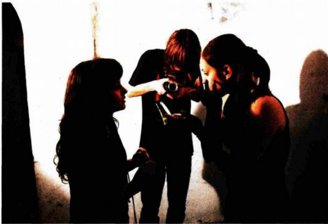
ŠMINKA JE BITNA

No nećemo sada sve otkrivati, već ćemo vam se prvi put uživo predstaviti nakon 15. filmske revije mladeži i trećega Four River filmskog festivala u rujnu u Karlovcu i to promocijom ovog filma u Callegru.