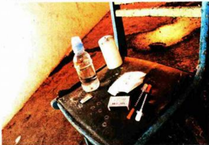
REKviziti su spremni