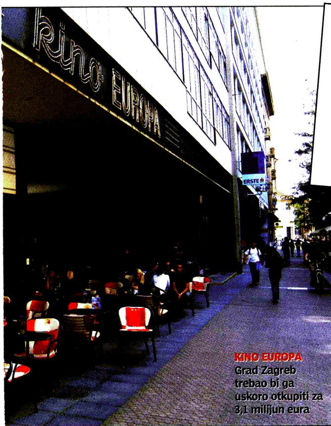
KINO EUROPA Grad Zagreb trebao bi ga uskoro otkupiti za 3,1 milijun eura

CILJ POBUNE OKO 200 FILMAŠA OKUPIT ĆE SE DA BI SPRIJEČILI NAJAVLJENU PRENAMJENU NAJATRAKTIVNIJEG KINA U ZAGREBU U PRATEĆU SCENU HNK