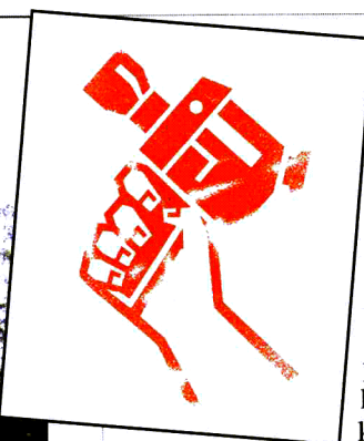
"DAJ MI KINO" Amblem akcije koja će pokušati "spasiti" zadnje gradsko kino

U igri moćnika kino Europa vjerojatno bi dobilo "coup de grace", poput konja na izdisaju. Igrom slučaja, inače pasivna filmska zajednica (da nije bilo protesta Ivana Galete, profesora Likovne akademije i renomiranog autora eksperimentalnih filmova, kino Tuškanac bi danas već bilo druga sce-